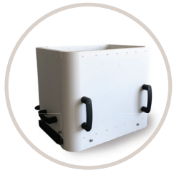
Casier de retrait de fabrication de la H350 de Stratasys

Simple et transportable Ajoutez ce dont vous avez besoin