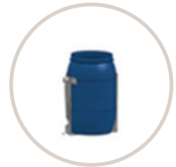
Conteneur de poudre de la H350 de Stratasys

Solution pour imprimante Stratasys H350 ou votre choix