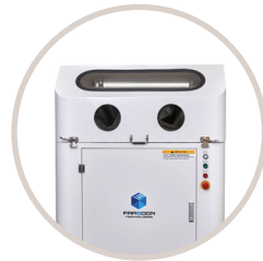
Station de récupération de poudre

Facilité de transport du casier de fabrication